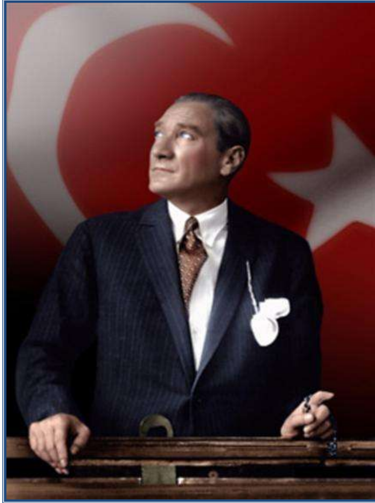
Mustafa Kemal ATATÜRK

“Çalışmadan, yorulmadan, üretmeden, rahat yaşamak isteyen toplumlar, önce haysiyetlerini, sonra hürriyetlerini ve daha sonrada istiklal ve istikballerini kaybederler”.